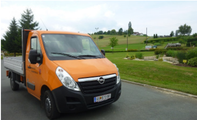
Der von der Gemeinde angeschaffte Pritschenwagen.