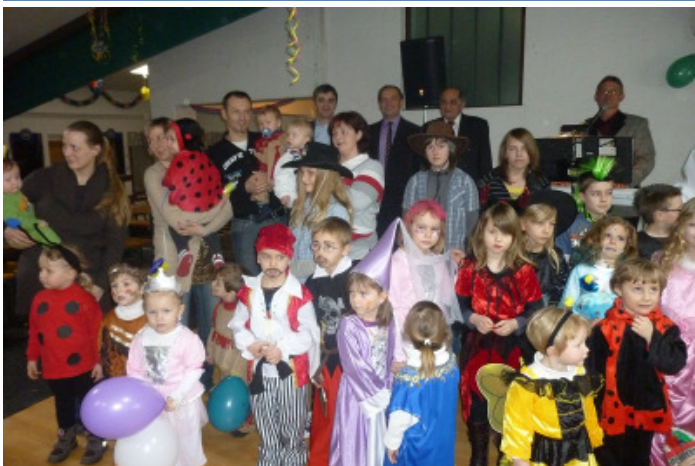
Viele Kinder und tolle Stimmung beim Kindermaskenball am 27. Feber.

Wieder einmal einen tollen Kindermaskenball erlebten viele Kinder am 27. Feber. Ein Teil vom Erlös der Veranstaltung wurde für Aktivitäten der Volksschule bzw. für die Volksschulkinder an der Schule Großmürbisch/Kleinmürbisch gespendet.