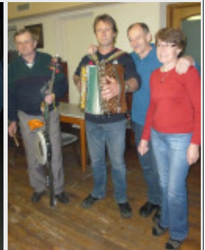
Einige der Akteure beim Maibaum-Aufstellen am 30. April.