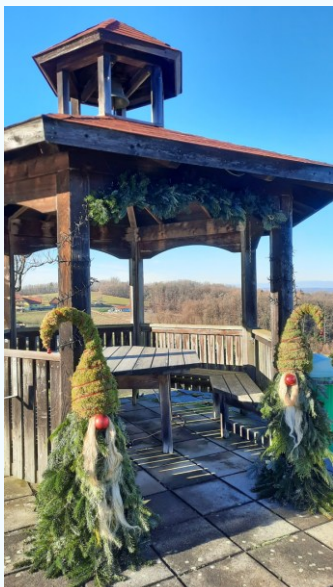
Dekoration beim Gemeindeamt

■ Etliche Frauen pflegen über das Jahr die Blumenkisterl bei den Ortseinfahrtstafeln und verschönern um Ostern und Weihnachten mit viel Engagement und Kreativität das Ortsbild beim Gemeindeamt und den Ortseinfahrten. Herzlichen Dank.