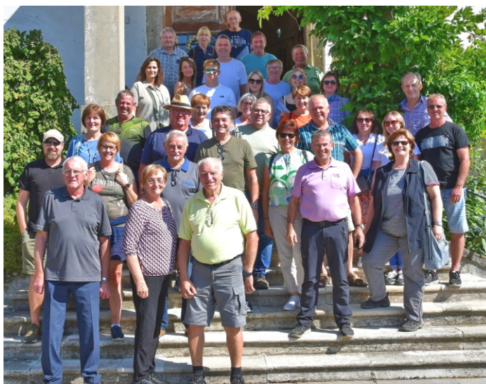
Die Teilnehmer beim Ausflug am 6. September im Schloss Kapfenstein