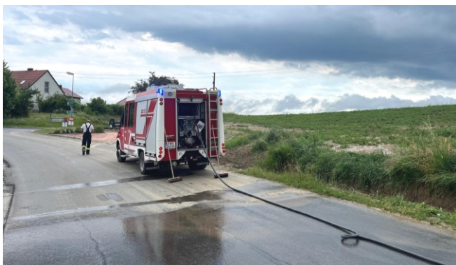
Einsatz nach Starkregen an der Kreuzung L401 nach Inzenhof