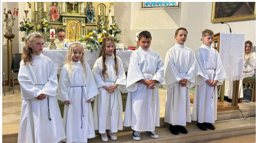
Die Kinder bei der Hl. Erstkommunion am 25. Mai in Großmürbisch.