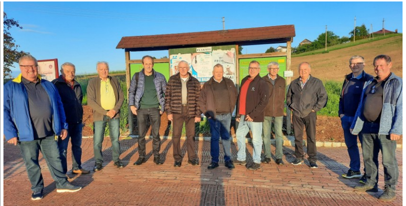
Die Teilnehmergruppe aus Kleinmürbisch bei der Männerwallfahrt am 10. Mai