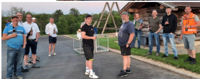
Verdiente Labung, nachdem der Maibaum aufgestellt war