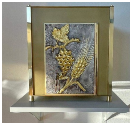
Der neu angeschaffte Tabernakel in der Leichenhalle.